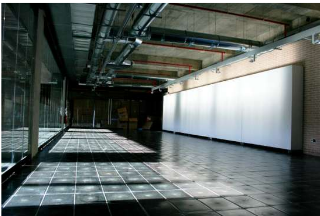
Vista general de Espacio Trapézio.

Así vemos que la programación es de orden holístico, tal vez la misma sazón del mercado San Antón proporcionará los ingredientes con la dosis perfecta para una mezcla que traiga nuevos sabores al mercado del arte.