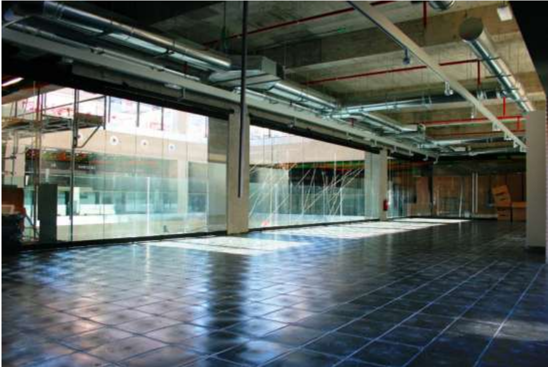
Vista general de Espacio Trapézio

Código Deontológico del Instituto de Arte Contemporáneo y de la lógica activa que implica la inclusión de públicos diversos, por el mismo hecho de haber ubicado el espacio en un sitio poco convencional.